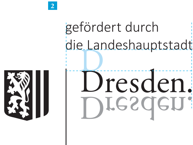
Logo Stadtverwaltung mit Textzusatz oben