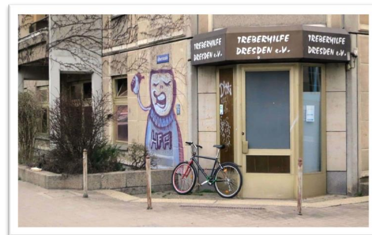
Mobile Jugendarbeit Jumbo