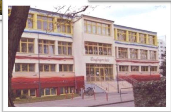
Schulsozialarbeit 101. OS / 102. GS & Dinglingerschule